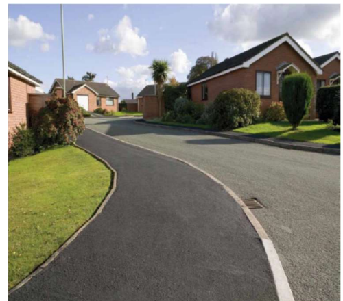
Gosod wyneb tenau (Ar ôl)