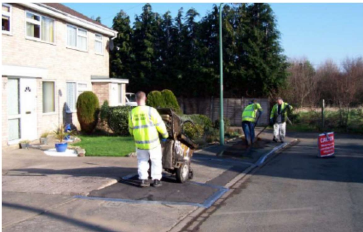
Gosod wyneb tenau (Cyn)