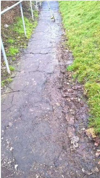
Llwybr troed cyn ei drin