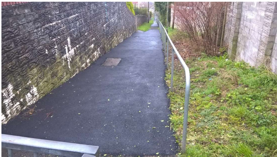
Llwybr troed ar ôl ei drin