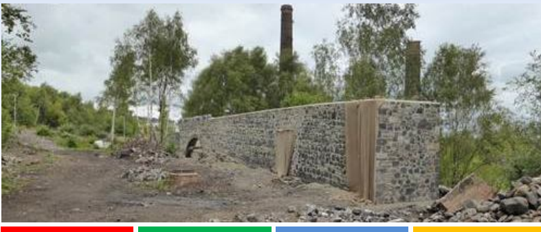
Gwaith atgyweirio wal restredig