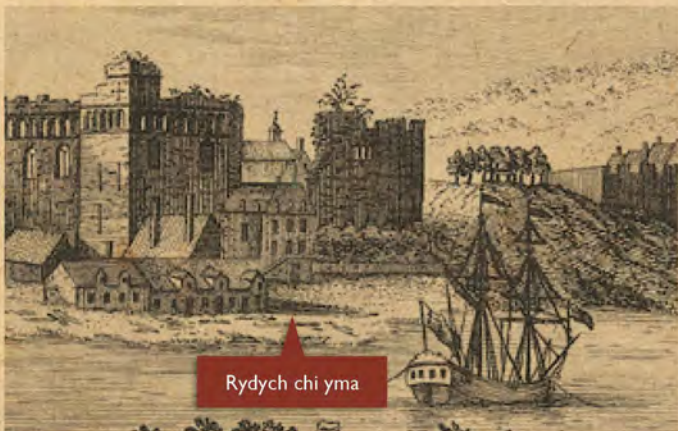
Manylion o'r print o 1745 gan y brodyr Buck.

Byddai'n rhaid i chi wisgo welingtons i gerdded ar hyd y fan yma 200 o flynyddoedd yn ôl. Mae'r darlun isod yn dangos fel yr oedd yr Afon Tawe'n arfer llifo ychydig yn is na'r castell. Rydych yn sefyll yn y fan lle'r oedd llongau a chychod wedi eu hangori ar hyd glan yr afon. Heddiw, enw'r stryd yma yw'r 'Strand', sef hen air Saesneg am 'glan'. Yn y fan yma y byddai pobl wedi casglu'r cerrig llyfn hynny a ddefnyddiwyd i adeiladu rhannau o'r castell. Yn 1845, newidiwyd llwybr yr afon i greu llwybr haws i'r môr ar hyd y New Cut, ac yn 1852 daeth hen lwybr yr afon yn ddoc arnofiol.