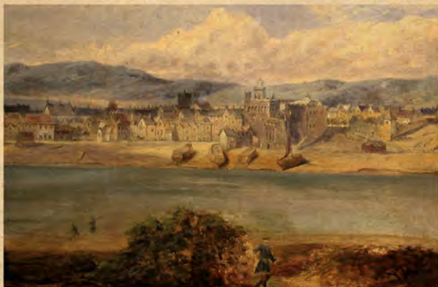
Golwg ar Abertawe, ar sail y print o 1745 gan y brodyr Buck. (Dinas a Sir Abertawe: Oriol Gelf Glynn Vivian)

Yn 1192, rhoddodd Tywysog Deheubarth (yr Arglwydd Rhys) warchae ar y castell am ddeg wythnos a llwgu pobl yn y castell i farwolaeth. Achubwyd y castell yn y diwedd. Yna yn 1217 daeth ei fab ffyrnicach fyth, Rhys Gryg, i ddinistrio'r castell a thafu'r Normaniaid allan o Benrhyn Gŵyr. Wedi iddo gael ei ddistrywio a'i losgi lawer gwaith, ailadeiladwyd y castell o gerrig.